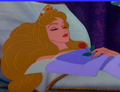
VII „а“ клас