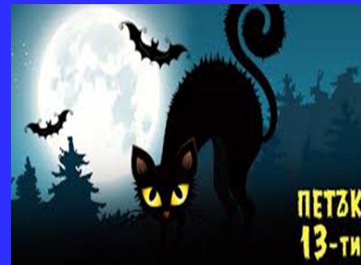
VII „б“ клас